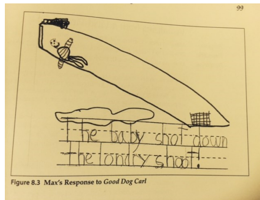
Figure 8.3 Max's Response to Good Dog Carl

Libros con fotos se pueden utilizar para aplicar esta estrategia. Estos libros se conocen como “libros sin palabras” y son útiles para niños pequeños, como también para los de edad más avanzada. Este tipo de libro ayuda al lector a construir el sentido o el significado de lo que va leyendo, dándole ejemplos de la estrategia y cómo trabaja.